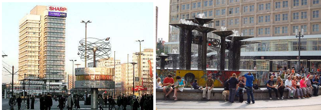
Fra Alexanderplatz med verdensur og den omstridte fontenen

Tilbake på Alexanderplatz 1730. Det er steknett og en føler seg seig fra topp til tå. Uteservingen frister. Det blir et glass Riesling. Deretter kaffe avec og Apfelstrudel. Vi nyter livet og filosoferer over turen, morer oss over inntrykkene fra Karl Marx Allè, eller Bier & Wurst Strasse som vi har døpt den til. Betrakter fontenen på Alexanderplatz som er kåret til Berlins styggeste. Sponset av Mac Donalds? (Se den selv, så skjønner du!)