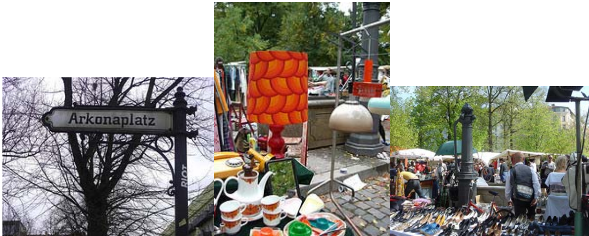
Markedsboder på Arkonaplatz

Fornøyde går vi videre til Flømarkt am Arkonaplatz.