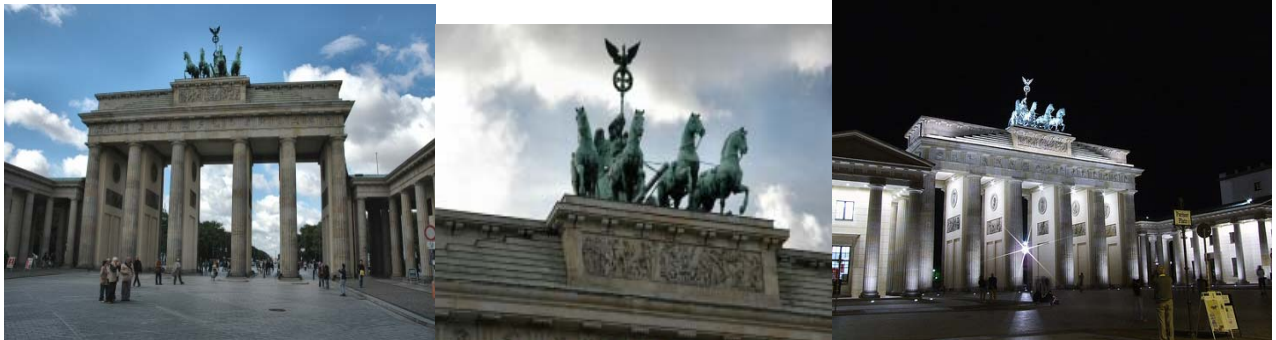
Brandenburger Tor med Quadrigaen

Etter å ha blitt orientert om Triumfbuens historie gjennom århundrene, var det tid for en halv times pause med kafebesøk. Et glass Riesling ble inntatt i en lekker kafé i foajén i et nybygget bibliotek i umiddelbar nærhet av Triumfbuen, og dette smakte fortreffelig. Så fortsatte ferden videre med tema som: