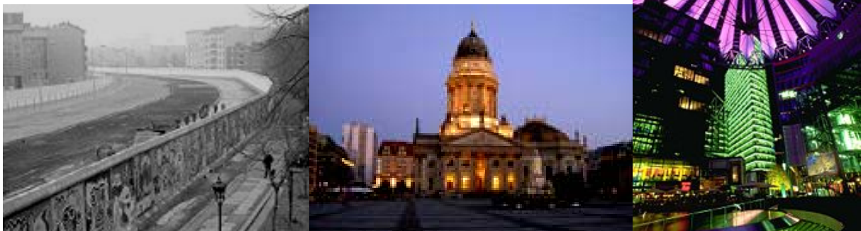
Bilder fra muren, Gendarmenmarkt og Potsdamer Platz