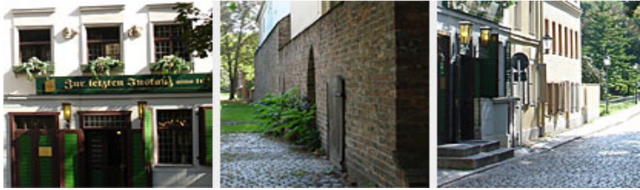
Berlins eldste verthus Zur letzten Instanz.

Dessverre var ankomsten til Berlin så sent på kvelden at vi ikke kom fram tidsnok til å rekke matserveringen, slik vi hadde planlagt. Men vi fikk da studert menyen og vi tok et glass deilig vin. Inntrykket var meget bra og vi bestemte oss for at neste dag skulle middagen inntas her.