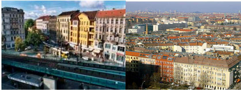
Fra Kastanienallée i Prenzlauer Berg.

U2 til Eberwalder Strasse i Prenzlauer Berg. Ankomst Mauerpark kl 1030.