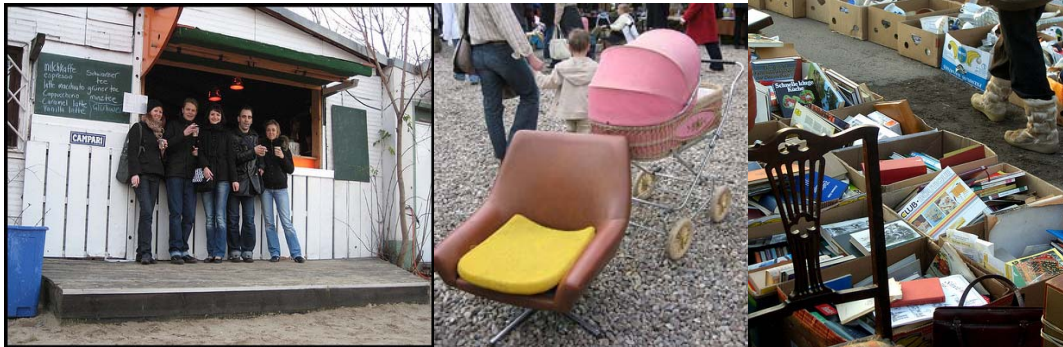
Man kan finne mye rart på Flohmarkt am Mauerpark

Solen steker og vi søker skyggen i en grønn oase ved inngangen med dertil hørende servering. Wow, for et sted. En seidel Berliner Pilsner går rett ned. Ikke noen bein i denna nei! Glasspant. Smaker herlig!