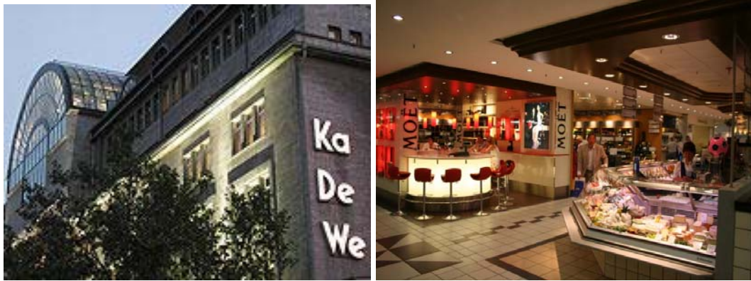
Varehuset KaDeWe og en av de 30 Feinschmeckerbarene i 6. etg.

Kl 1200 Avreise med U2 til Wittenbergplatz, bydel Charlottenburg. Besøk på KaDeWe – Kaufhaus des Westens – det største og mest eksklusive varehus i Europa. Endelig!!