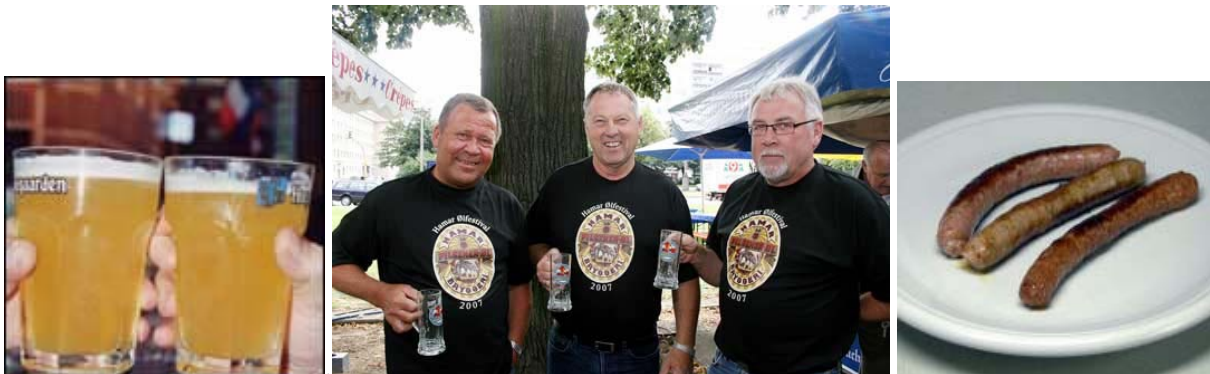
Drei norweger am Karl Marx Alle (Die Bier & Wurst Strasse)

MEN, dagen er ikke slutt, i alle fall ikke for den ene av oss. En følelse av at man burde ha vist seg frem i svart T-shirt kommer snikende. Av med skjorte og scarf, på med HCØ-shirt og av gårde igjen. Trikk fra Agon til Alexanderplatz, U5 til Weberwiese. Til fots nordover på Karl Marx Alle. Stand nr 18-20 (hvilke bryggerier er ukjent), og der, sitter plutselig en liten gjeng som har holdt det gående i mange timer. Det er også andre norske festivaldeltakere i området