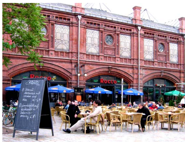
Fra en av oasene ved Hackerscher Markt.

Det ble tid til et glass øl på en av uteserveringene før start kl 1030.